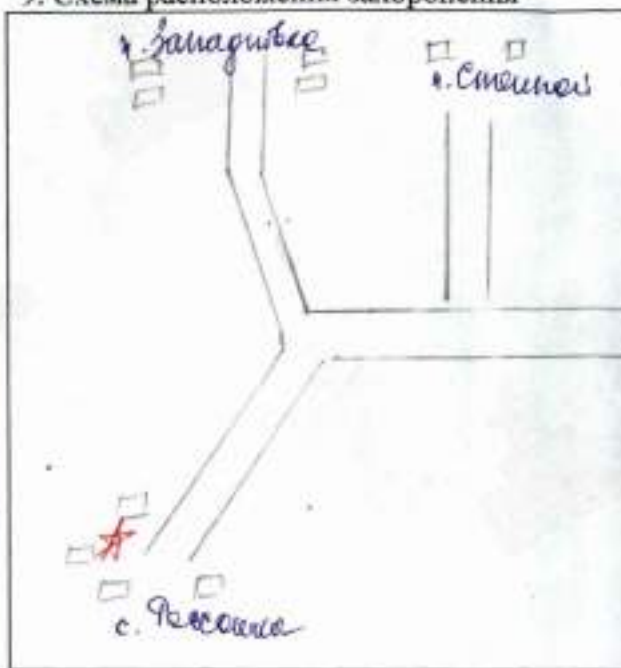
9. Схема расположения захоронения