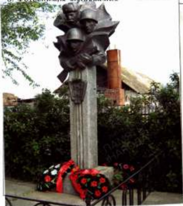
8. Фотоснимок захоронения