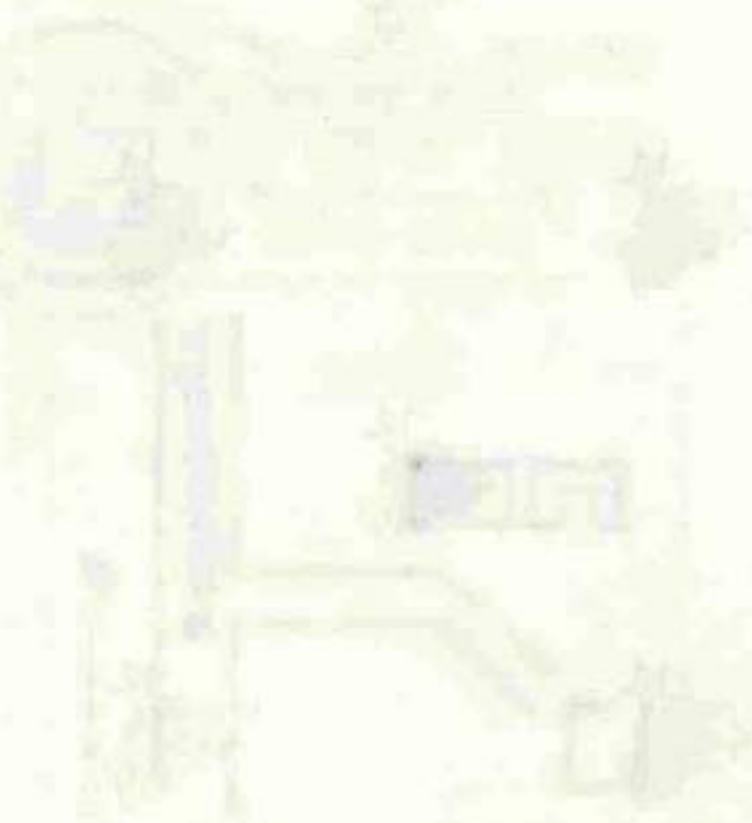
11. Продолжить информацию о захоронении